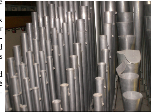
Les tuyaux de la Trompette vers la droite et les jeux de Type Principale.

L'orgue s'est reconstruit de fond en comble en 2006 aux bons soins du curé le Père Luc, OFM de la compagnie italienne d'orgues Alessandro Giacobazzi.