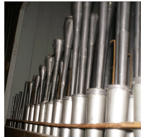
Le rang d'Hautbois (extérieurs) et de Celeste (Voix Celeste) en arrière.

Texte: Christos Paraskevopoulos Translation: Tina Bacopoulou