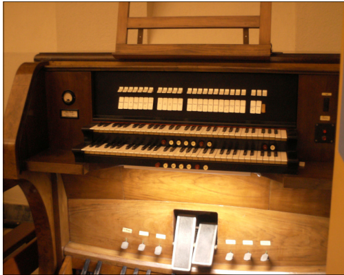
La console de contrôle de l'orgue Pinchi.

L'orgue d'église de l'église catholique de Saint François d'Assise est une construction qui date depuis 1939 et qui a été fabriquée par la fameuse usine italienne PINCHI. Sa fabrication a été complétée peu après l'éclatement de la Deuxième Guerre Mondiale selon le fils du fabricant Guido Pinchi. Il est, jusqu'aujourd'hui, le plus grand qui existe dans une église grecque. Il est composé de deux claviers pour les mains ainsi que d'une série de pédales. La console de l'orgue se trouve aux bas fonds du temple et est connectée aux tuyaux par un câble épais. Dans ce cas là, nous avons ce que l'on appelle « transmission électrique ».